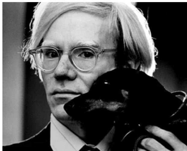
Fig. 1. Andy Warhol (fotografía por Jack_Mitchell, 1975). (Wikipedia, Creative Commons).

reconoce la ingesta de 2 comprimidos de Valium, Seconal y Aspirina. A los que debe añadirse sustancias como Demerol (meperidina) o morfina para aliviar los dolores producidos por las crisis biliares.