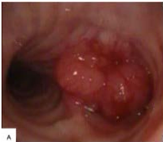
Figura 2. Tumor multilobulado com aspecto de cereja, com base de implantação na parede posterior da carina estendendo-se para A esquerdo condicionando obstrução de 90% do lúmen brônquico não permeável ao broncofibroscópio (A); Re-avaliação endoscópica 1 ano após laserterapia: alargamento da carina traqueal com infiltração tumoral e neovascularização que se insinua para A esquerdo e A direito sem contudo condicionar diminuição do lúmen (B).